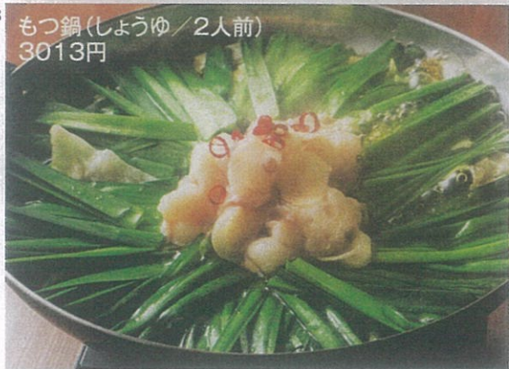
もつ鍋(しょうゆ/2人前) 3013円