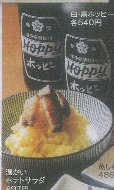
温かい ポテトサラダ 497円