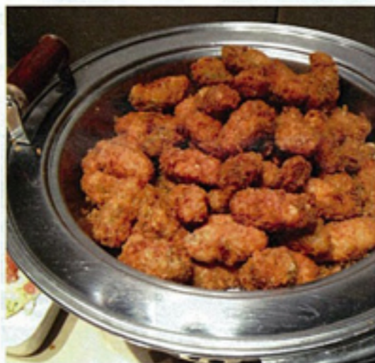
▲ぷくぷりの新鮮な牡蠣のフライがお腹いっぱい食べられる♪