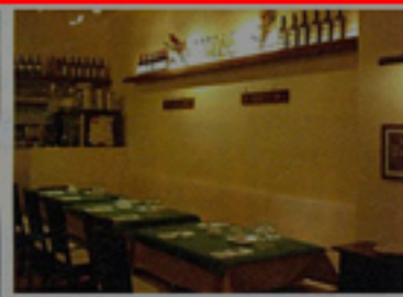
▲雰囲気のあるゆったりした店内

●所在地/中央区銀座7-2 銀座コリドー街111 ●営業/月~木 11:00~23:00(L.O.22:00) 金 11:00~23:30(L.O.22:30) 土 11:00~22:30(L.O.21:30) 日祝 11:00~22:00(L.O.21:00) ●TEL/03-3572-1062