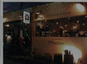
▲綺麗な装飾の外観が目を引きます